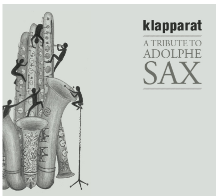
a tribute to Adolphe Sax 2014